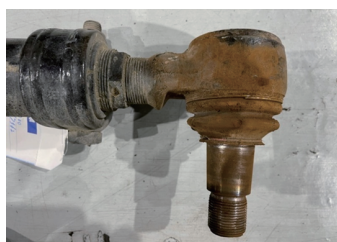
ボールジョイント全体に錆汁付着の例