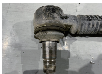
グリスが染み出している例

※ボールジョイント内部に水浸入してボールジョイントの錆が出ていると推定されるため