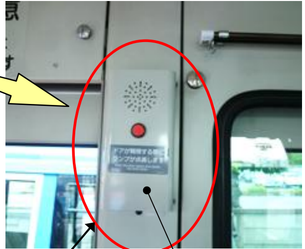
音声合成式 扉開閉予告装置 (制御プログラム)